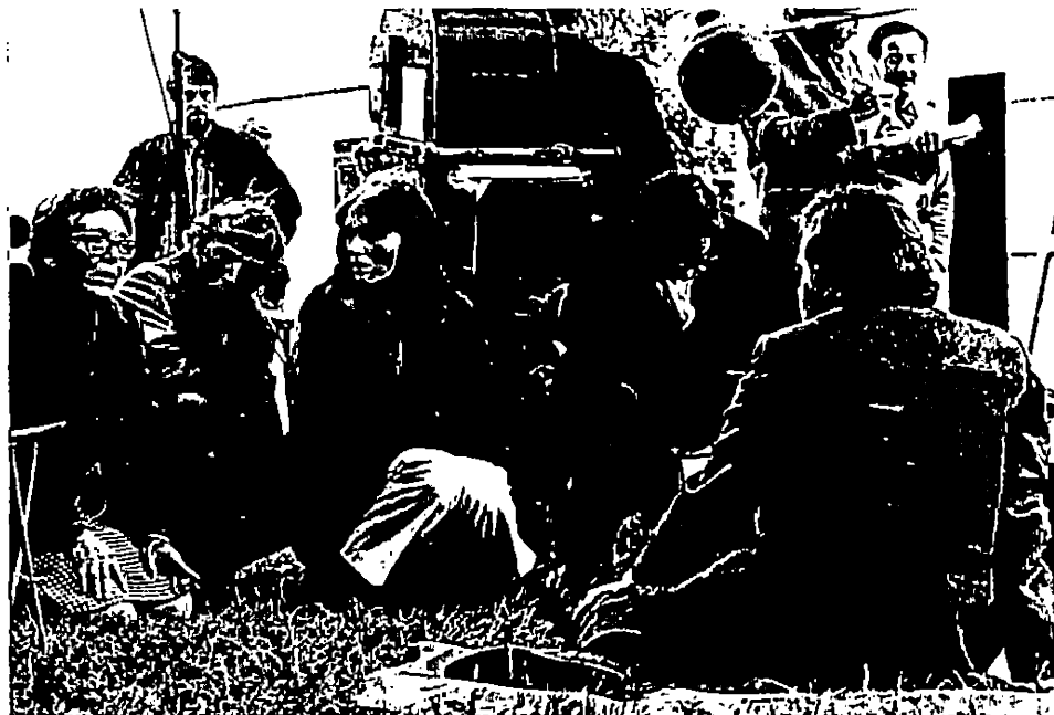
Tournage de « Détruire dit-elle ».

Narboni Oui : il est évident qu'au bout d'un moment, cette espèce de monde parallèle, forgé de clôtures secondaires à côté d'un système qu'on refusait de voir (et qui existe aussi, qui existe